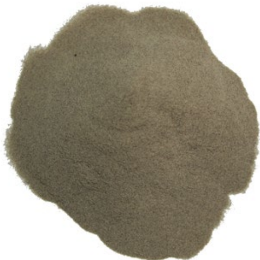
Рис. 2. Материал до истирания