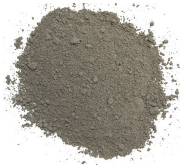
Рис. 3. Продукт истирания